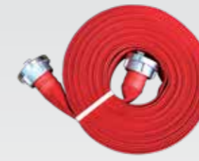
Basma Hortumu 20 metre