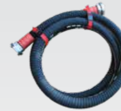
Emme Hortumu 3 metre

Dizel motor: 65 KW -2900 d/dk., dört zamanlı, marşlı, dört silindir (ETNA OEM marka)