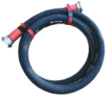
Emme Hortumu 3 metre

İki adet 2" emme hortumu 3 m, iki adet 2" basma hortumu 20 m, kurt ağızı bağlama rekorları, su püskürtme lansı, pompa üzerinde iki yollu klapeli emme ağızı, iki yollu vana kontrollü basma ağızı dahildir.