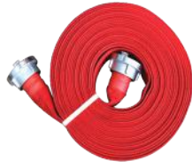
Basma Hortumu 20 metre